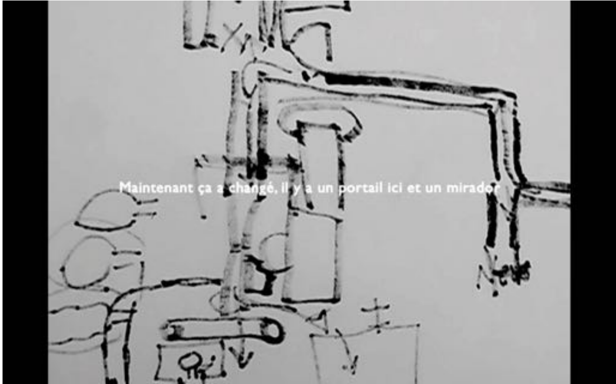
Fig. 1. Till Roeskens, Vidéocartographies , 2009. DV, 46 min. Film visible ici : https://vimeo.com/64089801?login=true

(2009) dans lequel, pendant 46 minutes, un plan fixe sur des cartes en train de se dessiner accompagne le récit oral et retranscrit à l'écran des habitants du camp de Aïda, à Bethléem, invités à décrire, par ce moyen, leur histoire dans le lieu qui les entoure 6 [Fig. 1].