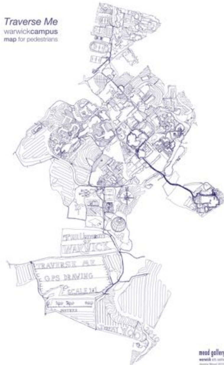
Fig. 3. Jeremy Wood, Traverse me . Warwick campus map, impression jet d'encre sur papier, 1 : 12000, 21 x 29,7 cm.

performatif relève de l'auto-observation propre aux pratiques de l'enregistrement et à la diffusion des tracés GPS qui, bien qu'ils soient issus d'une captation d'un satellite, autrement dit, vus d'en haut, n'en relèvent pas moins d'une esthétique horizontale du chemin de traverse et autres lignes d'erre ou de désir qui inspirent aussi bien les géographes que les psychiatres, les urbanistes que les artistes.